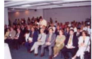
A la firma del Compromiso Ético asistieron representantes del Cuerpo Diplomático, representantes de los medios de comunicación social, directores y subdirectores del TE e invitados especiales.

Indicó que el compromiso que se asume ante la faz del país, es una herramienta indispensable en el papel de árbitro del proceso electoral.