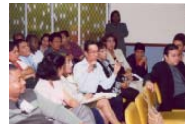
Educadores con perfil requerido por el Tribunal Electoral, son capacitados como instructores electorales.