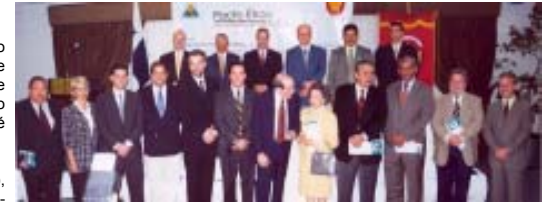
Representantes de los medios de comunicación social; de televisión, radio y prensa escrita, suscribieron el Pacto Ético, del cual el Tribunal Electoral fue auspiciador, y el Comité Ecuménico de Panamá garante.