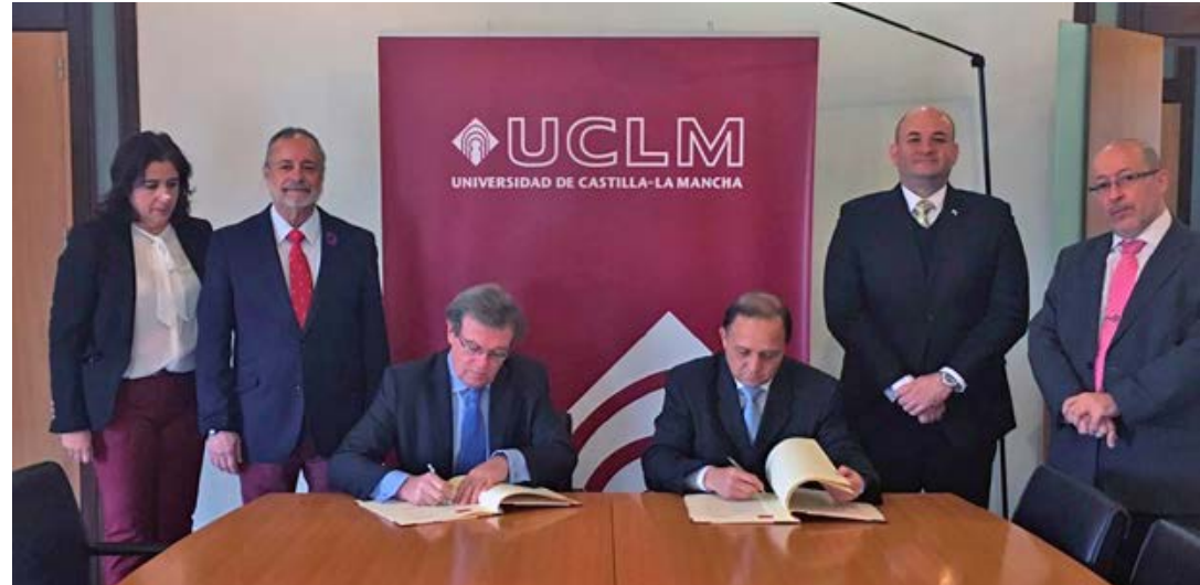
El convenio promueve la excelencia académica.

ibéricos, y a la fecha ya se registran los primeros resultados de este acuerdo porque un grupo de 25 funcionarios del TE iniciaron clases virtuales en la primera maestría de Derecho Electoral, de la Universidad de Castilla - La Mancha. El plan de estudio de este programa se concentra en importantes temas de la Ciencia Jurídica y el Derecho Constitucional como la justicia constitucional y el derecho electoral, desde una perspectiva jurídico-constitucional. La capacitación, al más alto nivel, busca promover la formación de nuevos inves-