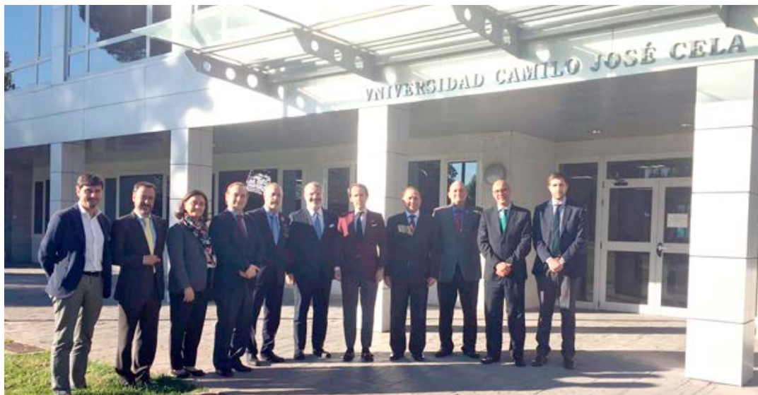
Gestionan cursos para líderes políticos de Panamá en universidad de España.

má y España para líderes políticos y colaboradores del TE, sobre programas educativos iberoamericanos de gobernanza y gobernabilidad. Esta iniciativa responde a los parámetros que establece la nueva Ley 29 que reformó el Código Electoral, y que establece que el Tribunal Electoral queda facultado para desarrollar y ejecutar programas de capacitación para dirigentes de grupos políticos y funcionarios electorales. El Municipio de Alcobendas también fue visitado por las autoridades electorales. Este municipio ganó el Premio Transparencia de Europa en su gestión administrativa.