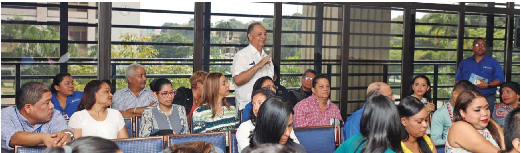
Comunicadores sociales se capacitan sobre reformas electorales.

El magistrado hizo un llamado a los periodistas a cooperar para que al final se logre el mejor proceso, en beneficio del fortalecimiento del sistema electoral y la democracia panameña.